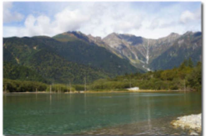
大正池～穂高連邦(長野県上高地) 六甲通り4番地 北国人さん