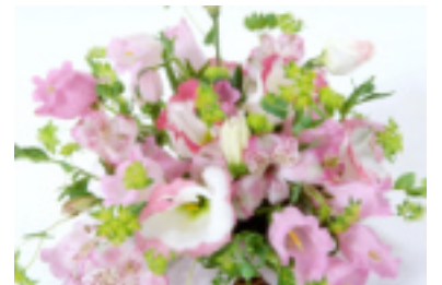
おすそ分けコーナー ピーナッツ通り1番地

そんなこんなで一年を迎えた文通村の夢は、日本中の手紙好きが集まる素敵な村になることです。の目標を書いていたたり、笹舟に乗せて手紙を送っていたりもしましたね。笹舟も多くの方に参加いただきました。笹舟は漂着しただけ、お返事がまだな方は一筆お返事を出していただけたら、お相手の方も安心するかと思えます。よろしく願います。